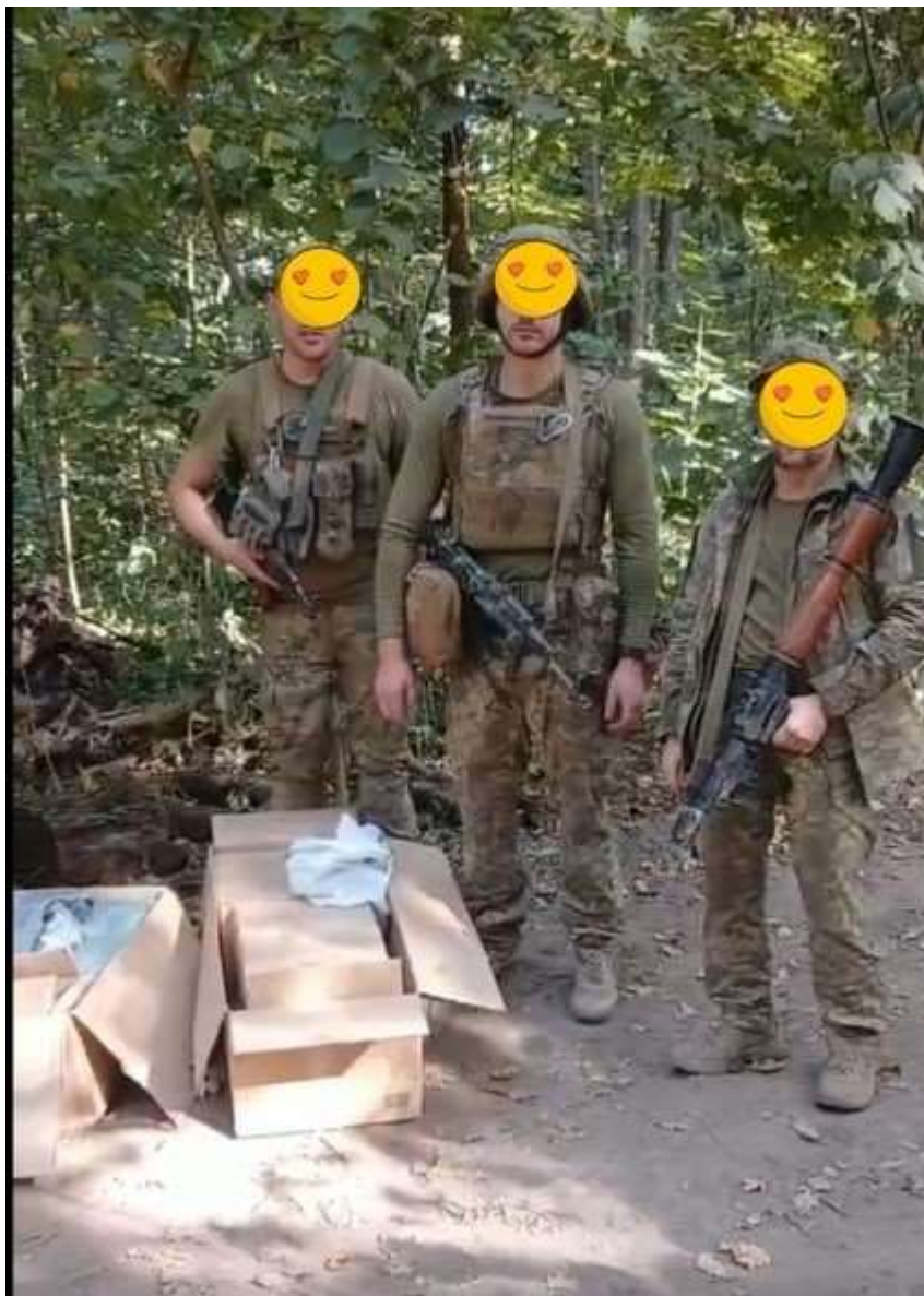
Пакунки на передовій і мила подяка від наших воїнів

Дякуємо нашим захисникам, воїнам ЗСУ за мужність та незламність. Дякуємо за кожен новий день, за те, що можемо жити і працювати на рідній землі. Проте, не лише словами дякуємо нашим захисникам. Працівники Обленерго закрили черговий запит з фронту, забезпечили військовослужбовців 95 ДШБ наборами з термобілизною, шкарпетками предметами гігієни та іншими речами першої необхідності. Наша постійна підтримка ЗСУ – це найменше, що ми можемо зробити для українських воїнів. Якби могли, то небо прихили б, щоб захистити наших захисників. А поки робимо цілком доступні речі. Тож, підтримуємо Збройні сили України не лише молитвами.