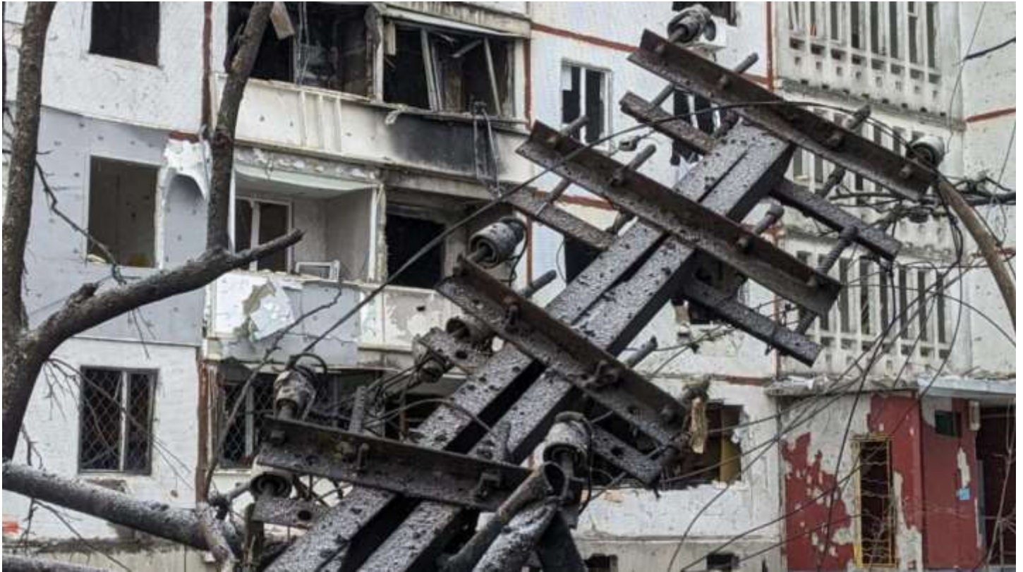
Харків, весна 2024 року

Таку ситуацію ми отримали внаслідок кількох потужних ракетно-дронових атак російських терористів по українських електростанціях з березня по червень цього року. Росіяни потрапляли чітко, відбитися вдавалося далеко не завжди. Відтак, Україна втратила 9 ГВт потужності. Для розуміння скільки це порохували в НЕК Укренерго: такі обсяги еквівалентні споживанню у пікові години влітку Нідерландів або Фінляндії, або разом – Словаччини, Литви, Латвії та Естонії. Немало.