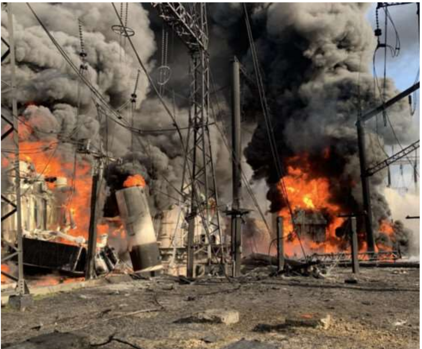
Ракетний удар рашистів 22 березня 2024 року

Через похолодання ( таке було на початку травня ) споживання електроенергії зросло. Покривати дефіцит в системі доводиться майже упродовж усієї доби завдяки імпорту, у пікові години – за рахунок аварійної допомоги від енергосистем Польщі, Румунії та Словаччини. І так щодня: аварійне постачання електроенергії від країн – європейських сусідок + імпорт. Але ці допоміжні інструменти не є сталими і не 100-відсотково стабільними – будуть у Європі надлишки і потреба їх «скинути», то добре. А як нема, то – вже ми самі якось. Саме так вдавалося ще певний час уникати погодинних відключень побутових споживачів, на перших порах за рахунок обмеження потужності для промисловості.