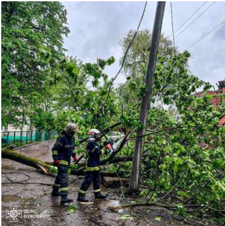
Чернівці, 12 червня 2024 року

Наступного разу в ніч на 29 липня наші аварійні бригади працювали до четвертої ранку, поки не заживили аварійно знеструмлених буковинців – загалом 12781 споживача краю.