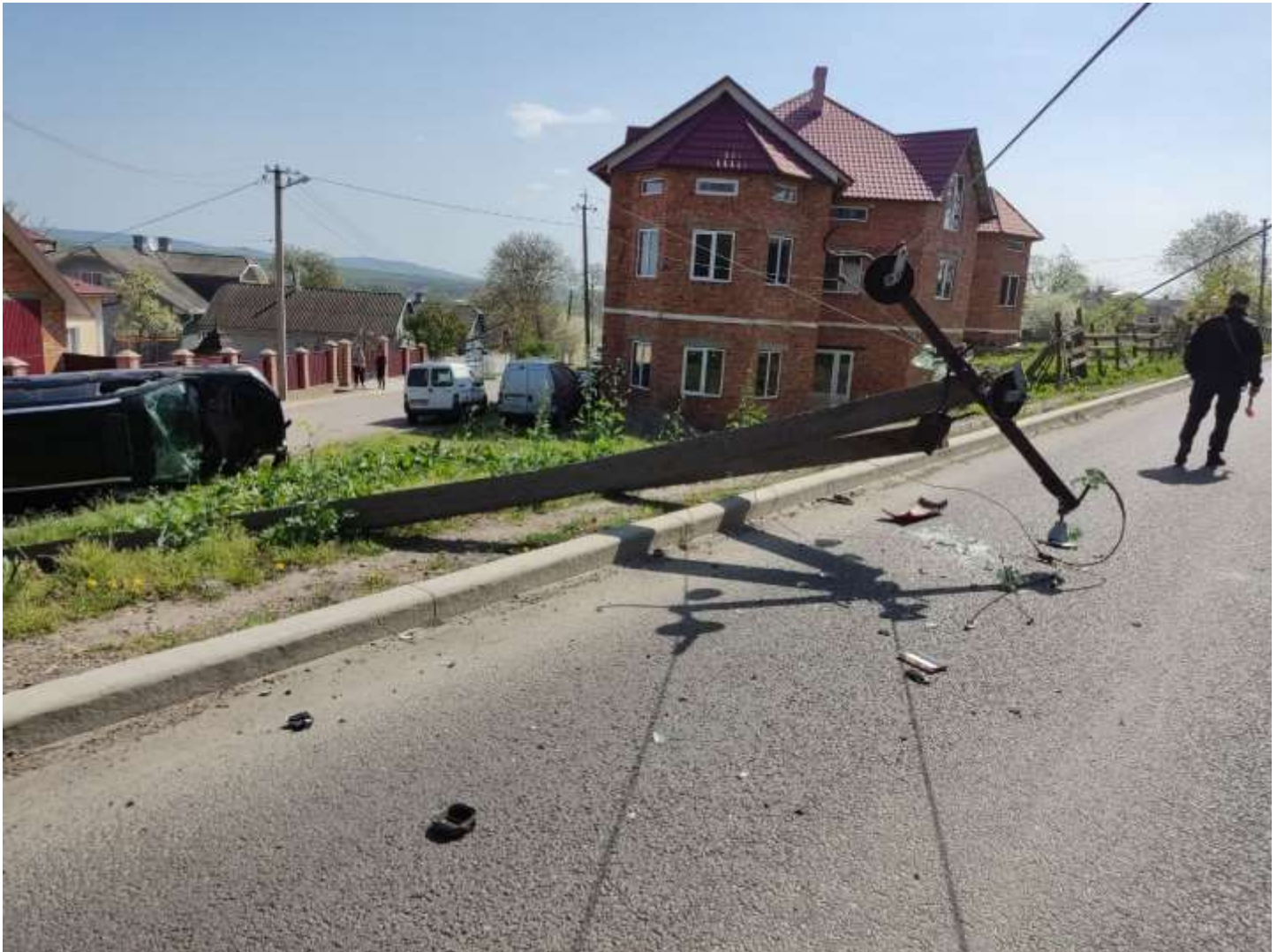
Лашківка, 12 квітня 2024 року

Загалом, виходить, що з початку року з усіх зафіксованих випадків ДТП за «участі» нашого електричного обладнання (тобто у 32 випадках), 9 водіїв – залишили місце пригоди або особи невідомі.