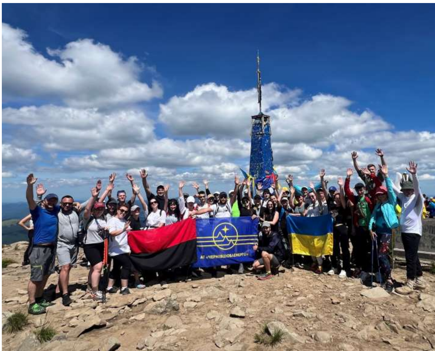
Говерла, дружній колектив, 6 липня 2024 року