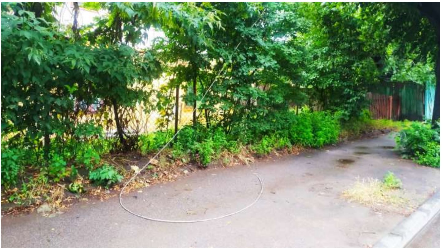
м. Чернівці, вул. Руська, унаслідок сильного вітру стався обрив ПЛ-0,4 кВ. 4 липня 2024 року

Тут і там у місті повітряні лінії прокладені вже багато років і щоразу доводиться здійснювати обрізку гілок дерев, які ростуть поруч з проводами. О, диво, – гілки завжди відрастають! І чомусь ніяк не відбувається «нищення дерев», які ось-ось мають захворіти, засохнути і відібрати у чернівчан тінь влітку. Те, що дерева щороку знову і знову дають пухнасту крону, учасники все-чернівецького хейту ( необ'єктивної критики ) звісно ж не помічають і укотре дають волю своїм «фаховим» коментарям. Як кажуть: ніколи такого не було, і от – знову. Нічого нового. Пережили.