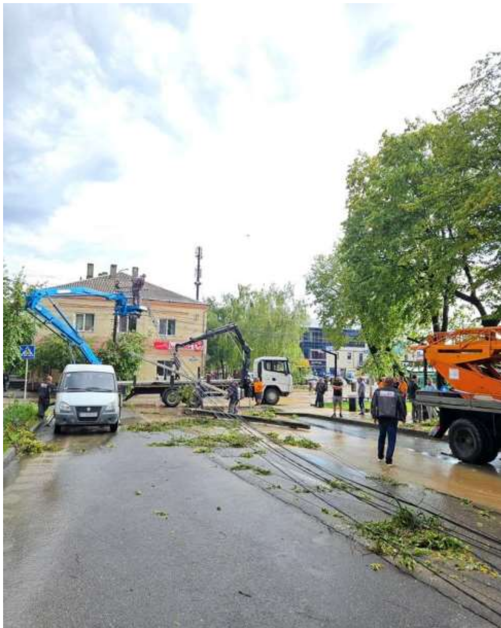
Чернівці, 5 червня 2024 року

Працюємо. На ранок 5 червня ще маємо не заживленими кілька абонентів у селі Рукшин та у мікрорайоні Садгора Чернівців. Тут після учорашньої негоди є серйозні пошкодження електричного обладнання, обриви проводів у кількох місцях, поламані опори, покручені траверзи, розбиті ізолятори.