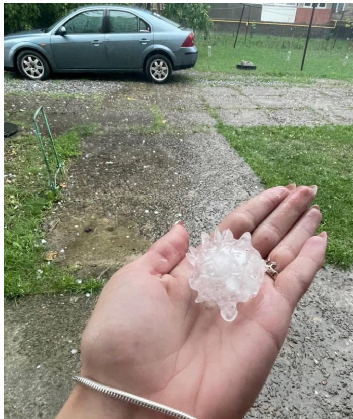
Такий град випав у Новоселиці.

Упродовж вихідних, 13-14 серпня і ще у наступні 15-16 числа останнього місяця літа на території області трохи бешкетувала стихія: пройшлася гроза з градом і шквальним вітром. Відтак, негода спочатку накоїла безладу у Новоселицькому, Путильському, Хотинському, Сторожинецькому та Сокирянському районах ( колишніх адміністративних територіях ). А згодом додалися ще Вижницький, Глибоцький та Кіцманський райони. Буревій спричинив руйнування електроопор, обриви й пошкодження проводів ПЛ 6-10 кВ та аварійні відключення в електромережах 10/0,4 кВ. Гроза та рвучкий вітер ламав дерева і гілки, які обривали проводи та призводили до інших пошкоджень електроустаткування. До прикладу, на Вижниччині пряме потрапляння блискавки вивів з ладу трансформаторну підстанцію ТП 10/0,4 кВ - 461, як наслідок мешканці села Іспас опинилися без електроживлення. Внаслідок негоди сталися вимкнення у трансформаторних підстанціях ТП-6-10 кВ, без електропостачання опинилися чимало абонентів у сотні населених пунктах краю.